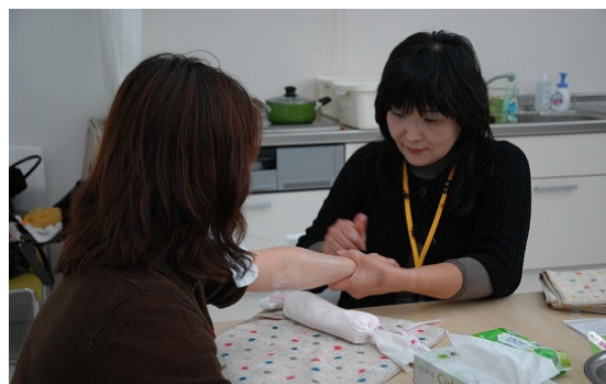
Handmassage durch eine Hebamme (Incl Iwate)

An diesem Tag fuhren 15 Mitarbeiter und Helfer von INCL-IWATE in die Küstenstadt Kamaishi, wo ein großer Bedarf an Unterstützung alleinerziehender Frauen und Witwen besteht. Auf dem Programm standen an diesem Tag Handmassage, Beratung zum Umgang mit Kindern in der Pubertät sowie Tipps von Studenten für die Vorbereitung auf die Universitätsprüfungen. Ursprünglich war die Handmassage nur als kleiner Anreiz gedacht war, um den Frauen den Weg in die Beratung zu erleichtern. 2 Tatsächlich aber herrschte dann bei der Handmassage so ein Andrang, dass sich lange Warteschlangen bildeten! Doch gerade der direkte Hautkontakt von Frau zu Frau erleichterte es den 22 Teilnehmerinnen, sich zu öffnen und das Gespräch zu suchen. Auf diese Weise fanden während der Handmassage viele intensive, persönliche Beratungen statt.