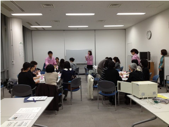
20 Mitglieder von INCL-IWATE werden von Kanebo-Trainerinnen in Handmassage ausgebildet

Die Handmassage konnte dank eingehender vorheriger Schulung durch das Kosmetikunternehmen Kanebo Cosmetics durchgeführt werden. Daneben hat Kanebo gemeinsam mit INCL-IWATE zu Beginn des Oxfam-Projekts eigene Schönheitsseminare für die Zielgruppe durchgeführt, die viele alleinerziehende Mütter überhaupt erst dazu bewegen konnten, die Beratung und Hilfe von INCL-IWATE zu suchen.