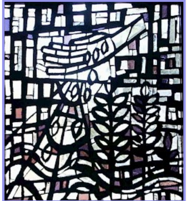
Fenster in der Andreaskirche in Niederstotzingen, http://www.evangelische-kirchengemeinde-niederstotzingen.de/ueber-uns/kirche/

sagt es Andreas; Andreas und Philippus gehen und sagen es