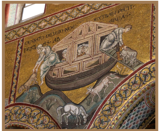
Noah-Zyklus: Nach der Flut werden die Tiere befreit. Kathedrale von Monreale auf Sizilien (Mosaiken von 1179-1182)

23 Und es geschah, dass er am Sabbat durch die Kornfel-